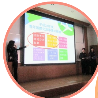
昨年度報告会の様子