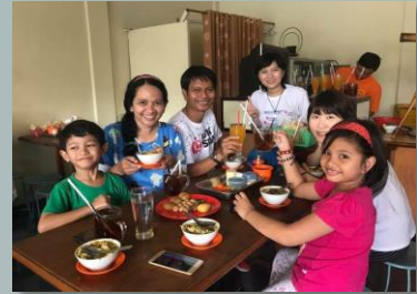
ホームステイファミリーと共に