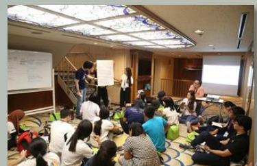
船内のディスカッション活動の様子