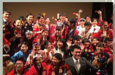
ナショナルプレゼンテーションで会場を盛り上げた日本参加青年