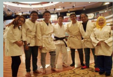
日本文化を体験する各国青年たち