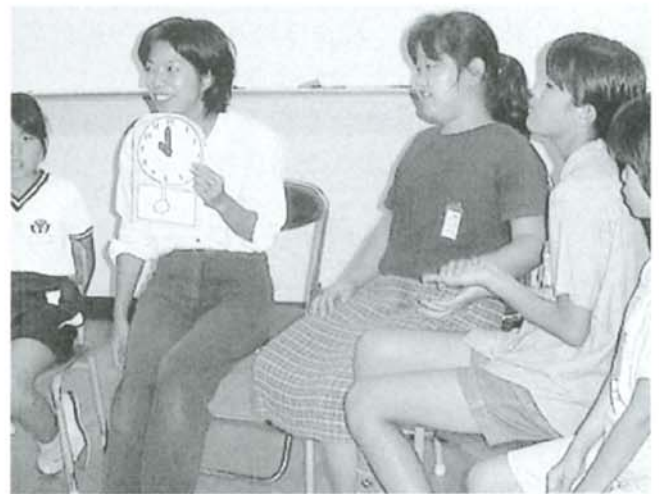
▲ 楽しい授業の展開をめざして

子供たちは、ローマ字を学校で習っていない学年の子、思春期（反抗期？）に入った子、海外旅行によく行く子など様々で、クラブの時間ごとに全体の雰囲気も子供の体調も違っているので、計画していた通りに進んだことはありません。毎回次の課題が出てきて、これでいいのかな、あしたらどうなるかなと試行錯誤の連続でした。子供たちの言葉や外国の事情に対する反応は、大人が考えているよりもずっと素直で素早いものがあり、手を抜いた内容にはできないと感じました。けれども、ただ面白いだけでなくメリハリのきいた内容にしていけば、子供たちはきちんとついてきます。子供たちの反応にどのように対応していくかという自分の力量が試されているように感じることもありましたが、逆に子供たちに助けられ、教えられたことも多く充実した時間だったといえます。この国際クラブが契機となって外国や世界のことに関心と好奇心をもってくれる子供が一人でも多くできてくれて、世界の中に日本があることを理解してくれれば幸いです。将来世界を舞台に活躍する人材となって地域や国をリードし、世界平和の基礎をともにつくっていくこれからの子供たちのために、今後もこのクラブが続いていくことを願い、できることはしてい