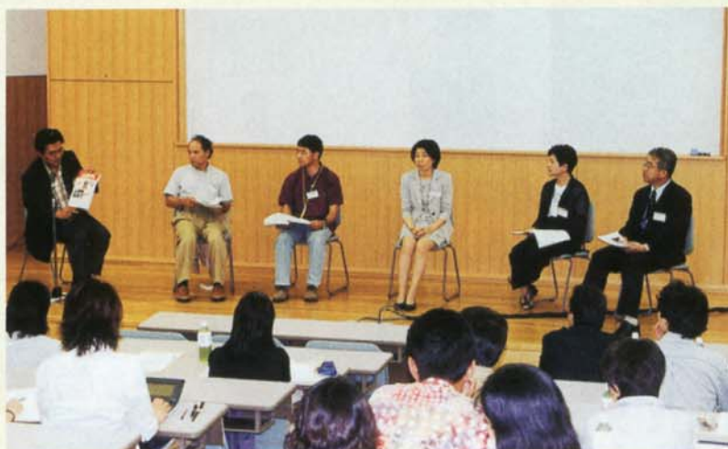
▲ 経験豊かな先輩の体験談を聞く貴重な時間