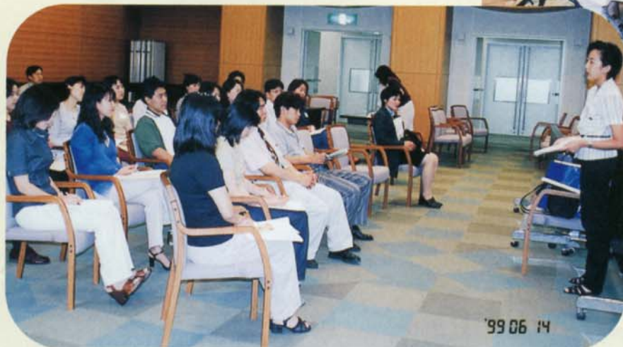
▲ 毎年好評なのが、椿副会長の「オリエンテーションの組み立て方」