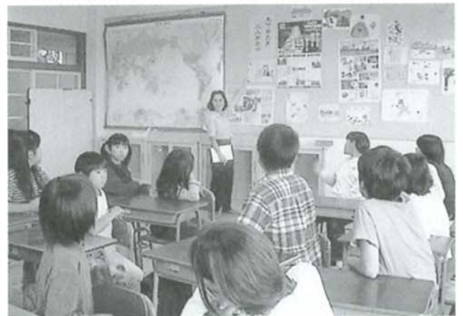
▲ 中国語の教室にて

に開かれた学校づくり」に取り組んでいる小学校に国際クラブの創設を提案するとともに、ボランティアスタッフとして同校のクラブ活動に参加することは、私たちならではの役割と意義があると考えました。言語を発したり習ったりすることは、交流における便利なツールに親しむということです。また、高知県青年国際交流機構のメンバーが入って教えるということは、海外派遣事